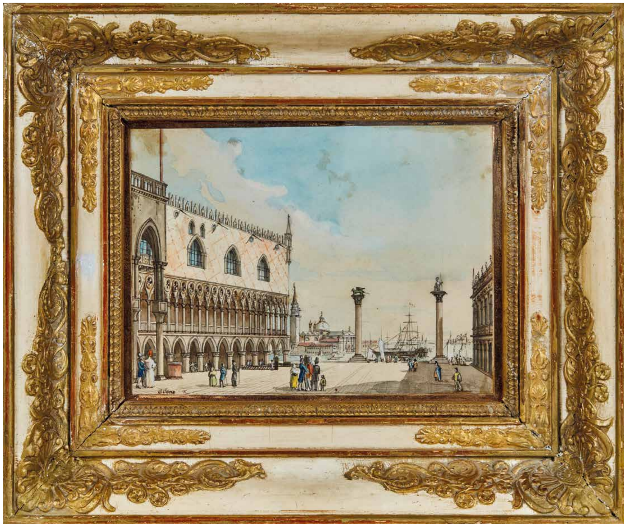
Veduta di Canal Grande da Piazza San Marco, 1815 – 20 circa, penna e inchiostro, pennello e acquarello colorato su carta, cm 20,5 x 15 - con cornice: cm 34 x 29, firmato in basso a sinistra: «Chilone»