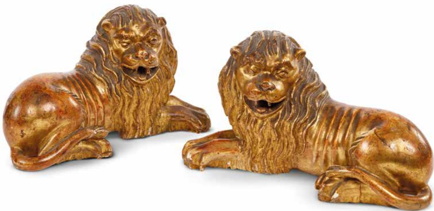
OPERA 33. COPPIA DI SCULTURE IN LEGNO DORATO

Le sculture lignee dorate rappresentano una coppia di leoni accovacciati, portatori degli ideali di forza e giustizia. Una lunga criniera mossata e fluente cala sui corpi vigorosi. La postura è autoritaria, lo sguardo fiero e le fauci spalancate comunicano prestigio e regalità.