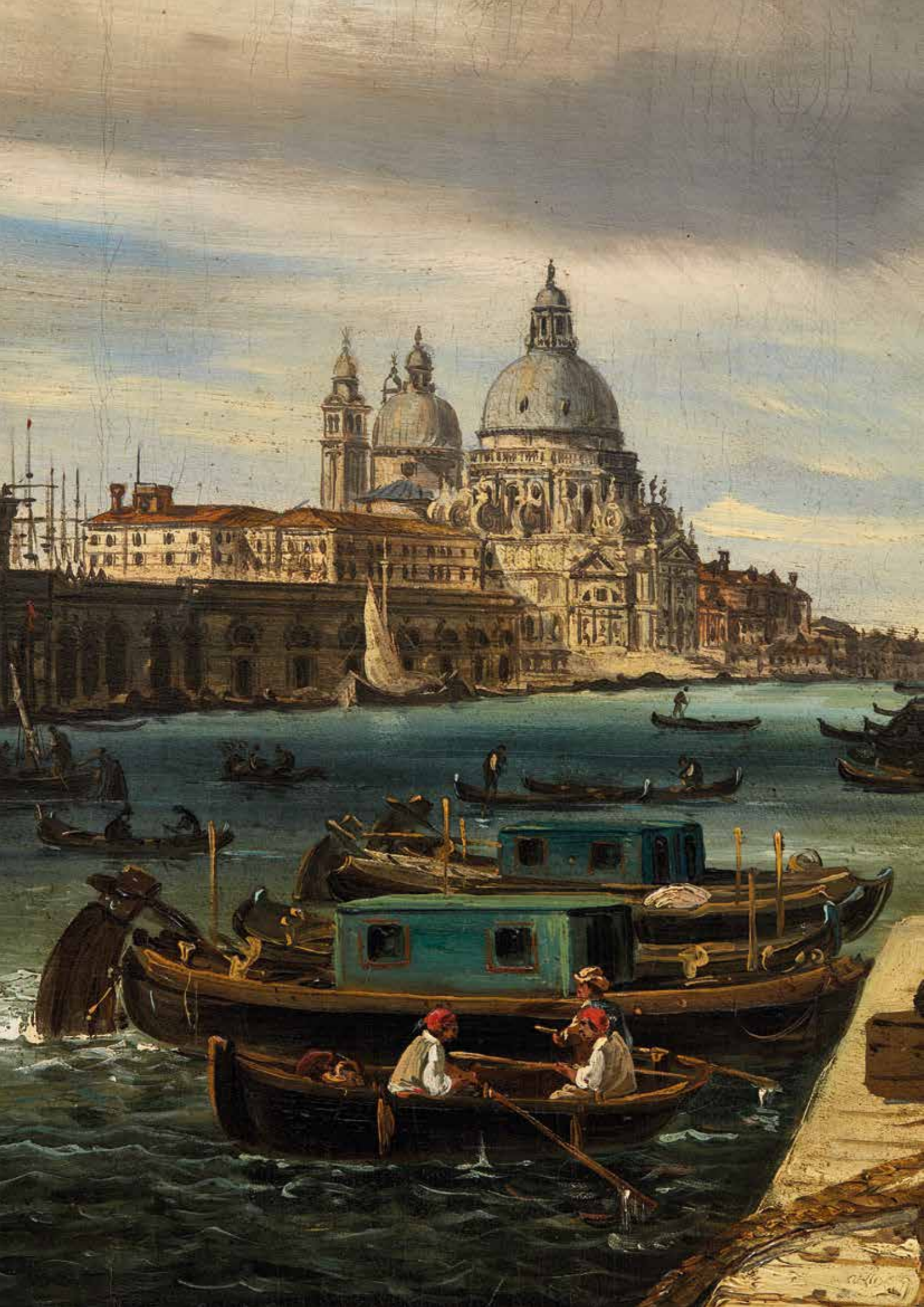
OPERA 12. GIOVANNI GRUBACS (VENEZIA, 1830 – 1919), VEDUTA DEL BACINO DI SAN MARCO CON IL PALAZZO DUCALE DALLA RIVA DEGLI SCHIAVONI