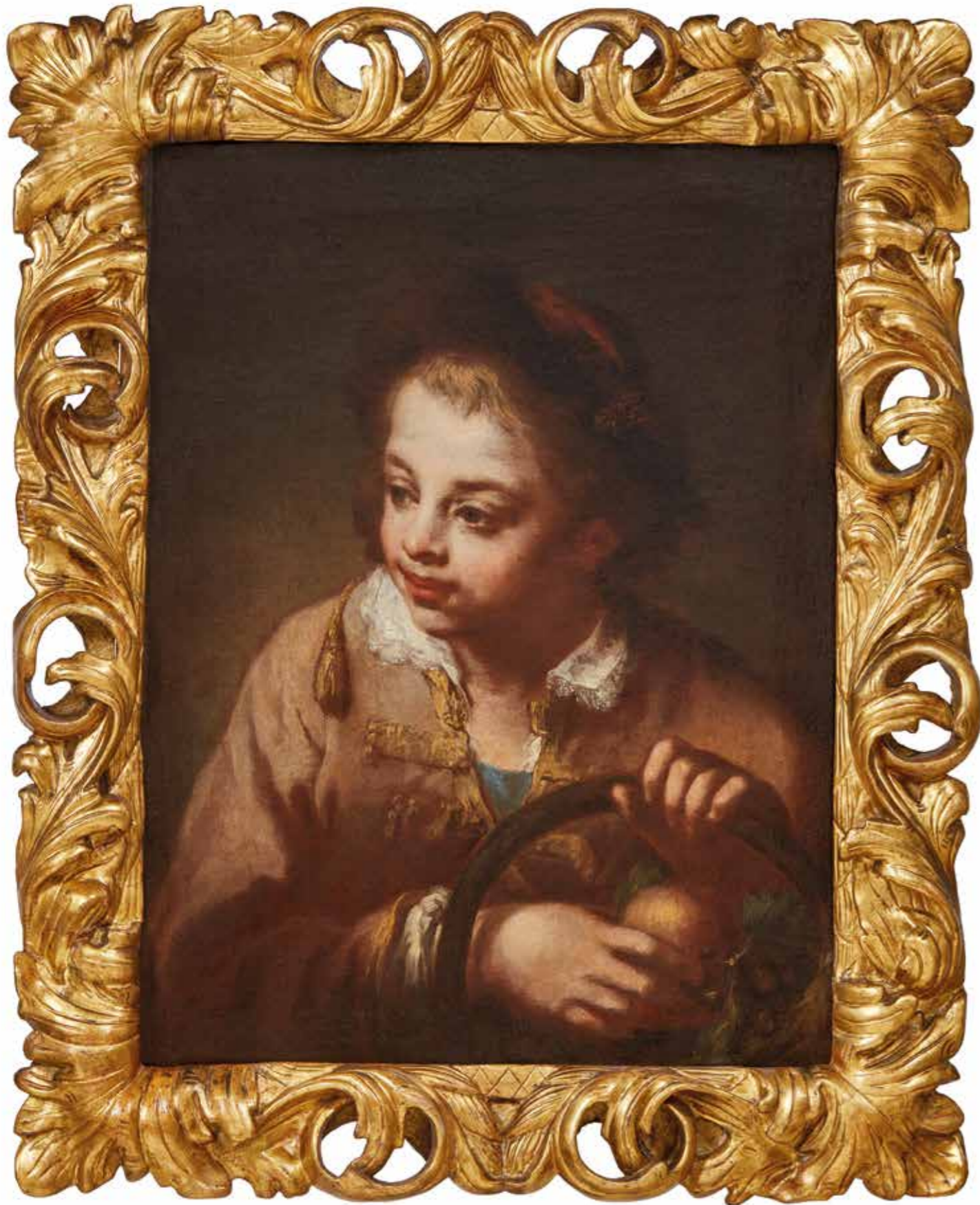
Ritratto di contadinello con cesto di frutta secondo quarto del XVIII secolo, olio su tela, cm 47 x 61