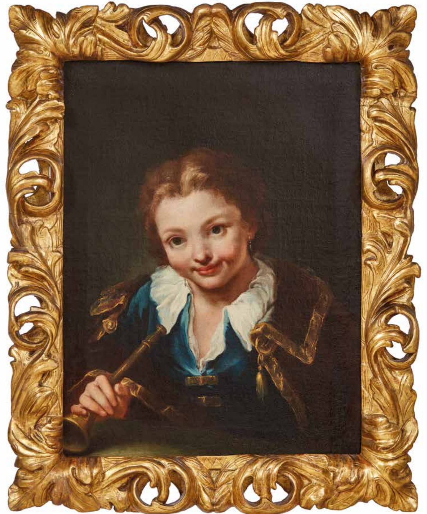
Ritratto di contadinella con flauto secondo quarto del XVIII secolo, olio su tela, cm 47 x 61