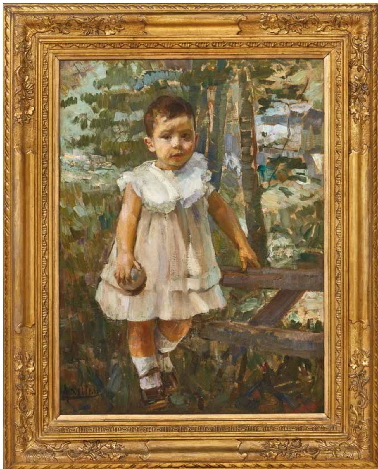
OPERA 45. ALESSANDRO MILESI (VENEZIA, 1856 – 1945), RITRATTO DI BAMBINA